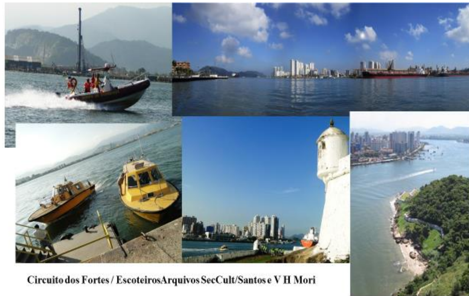
Circuito dos Fortes / Escoteiros