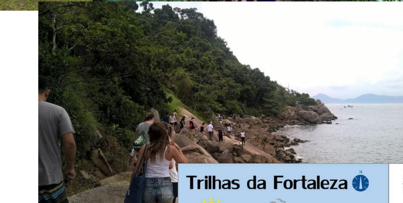
Acesso à Fortaleza da Barra é feito por outra trilha, que começa em Santa Cruz dos Navegantes, ou por embarcações vindas da Ponta dos Pretinhos, na Ponta da Praia, em Santos