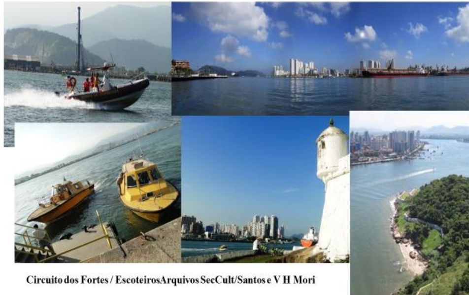
Circuito dos Fortes / EscoteirosArquivos SecCult/Santos e V H Mori