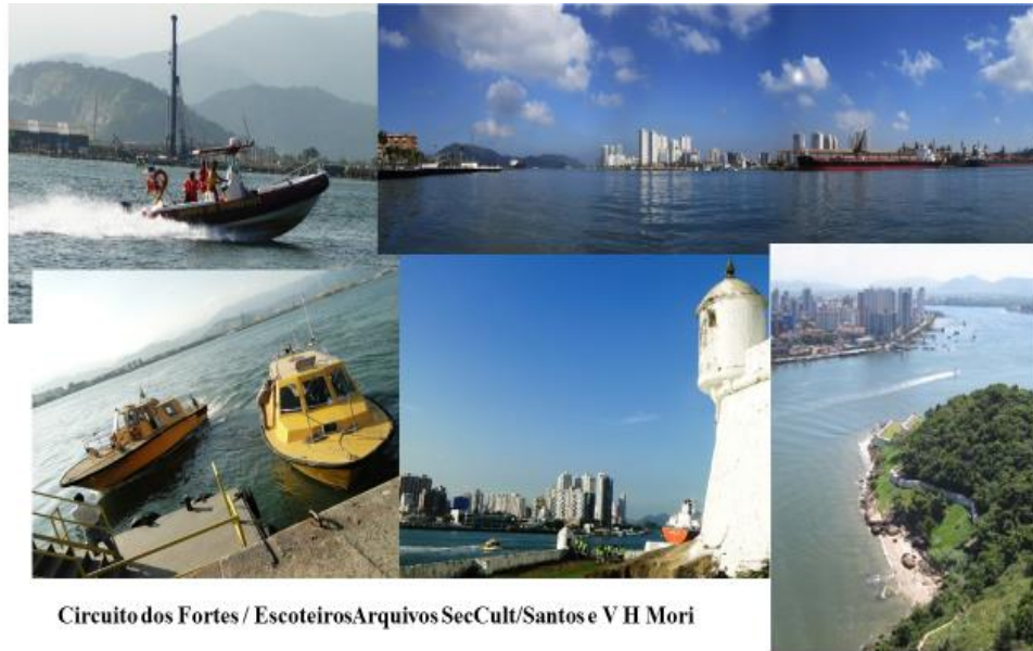
Circuito dos Fortes / Escoteiros